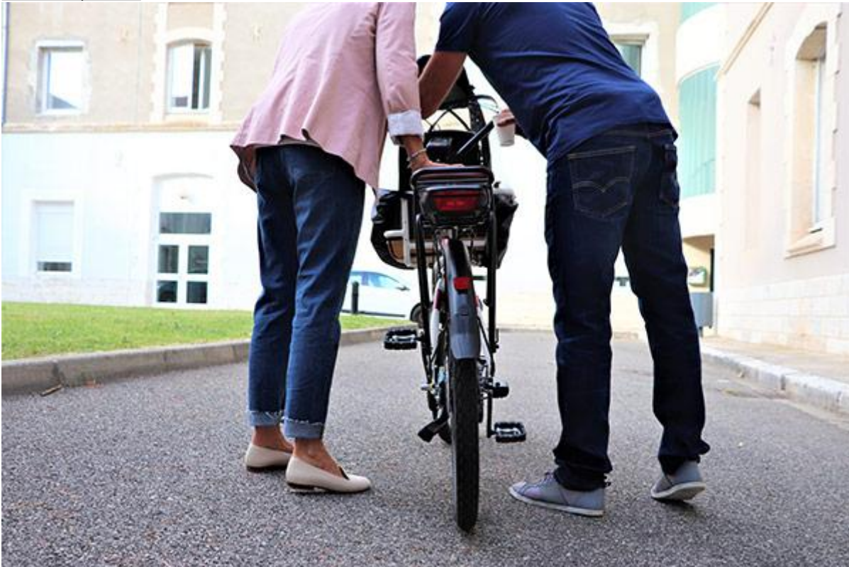
Atelier Saint-Marcellin Mobilité Vélo Pédale douce