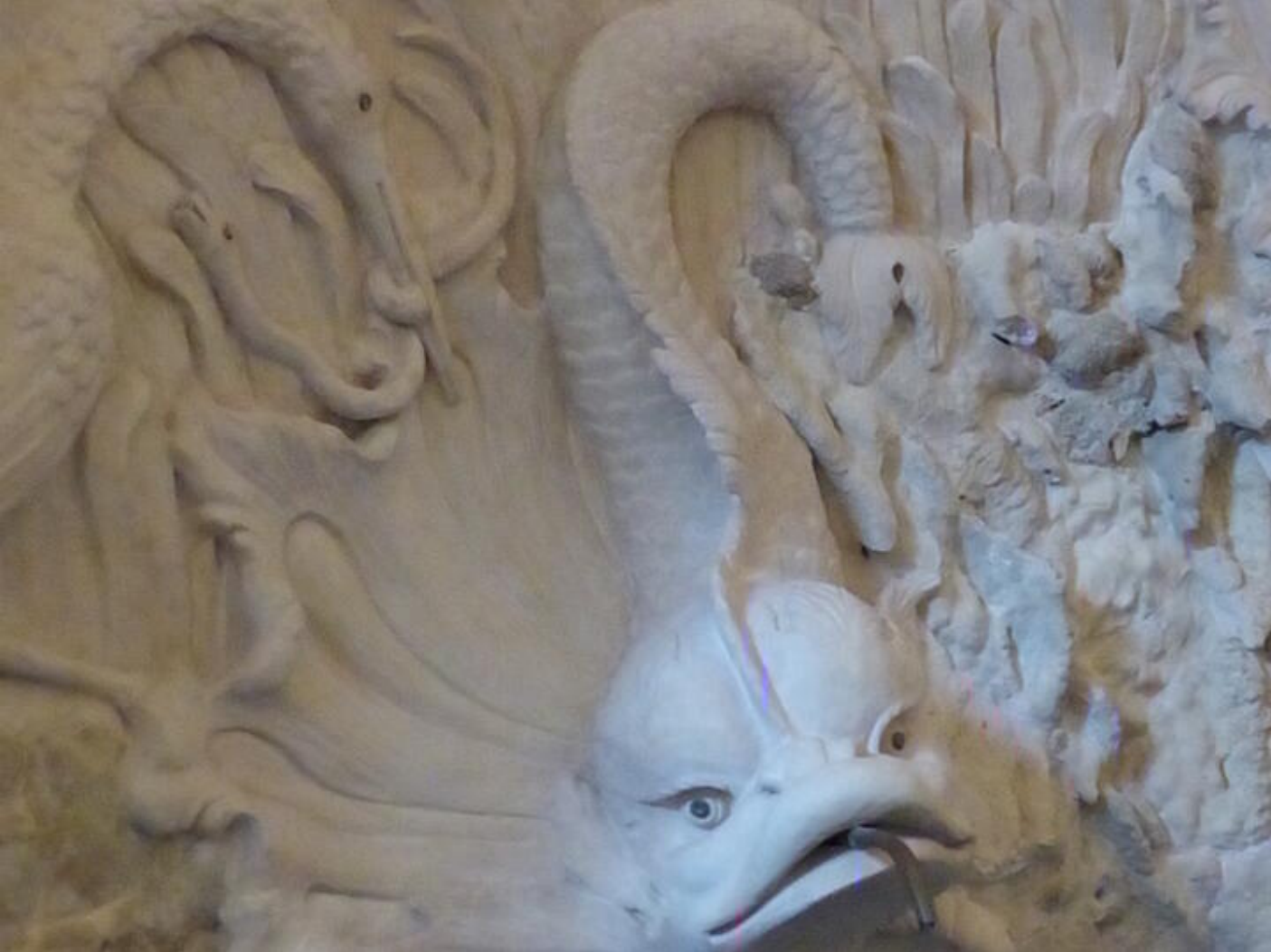
Visite guidée Saint-Antoine au fil du temps - Le temps des bâtisseurs : splendeurs du gothique 38160 Saint-Antoine-l'Abbaye

Visite permettant de découvrir des espaces qui ne sont pas ouverts au public.