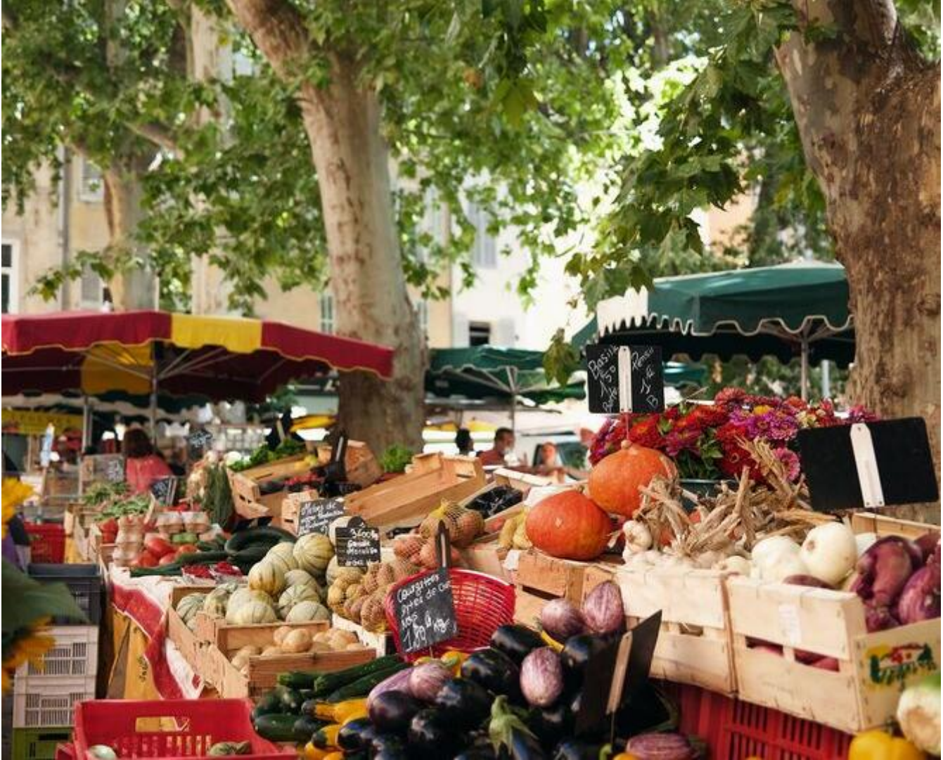
Marché alimentaire de Pont en Royans 38680 Pont-en-Royans Petit marché alimentaire Plus d'infos mer. 01 juil.