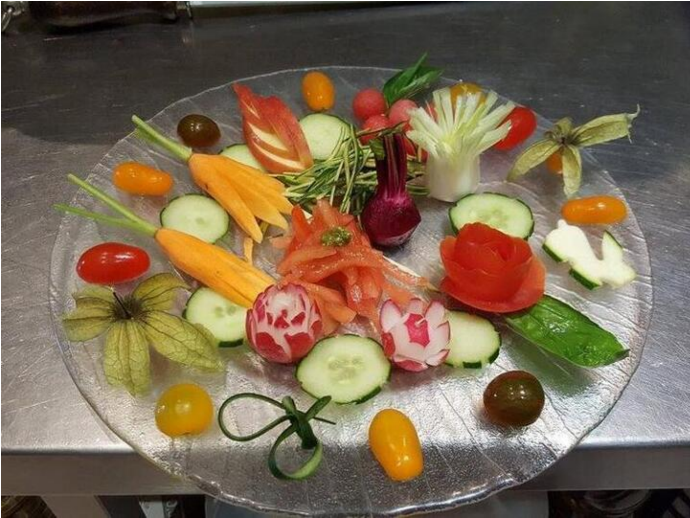
Le Beau Rivage 38680 Pont-en-Royans