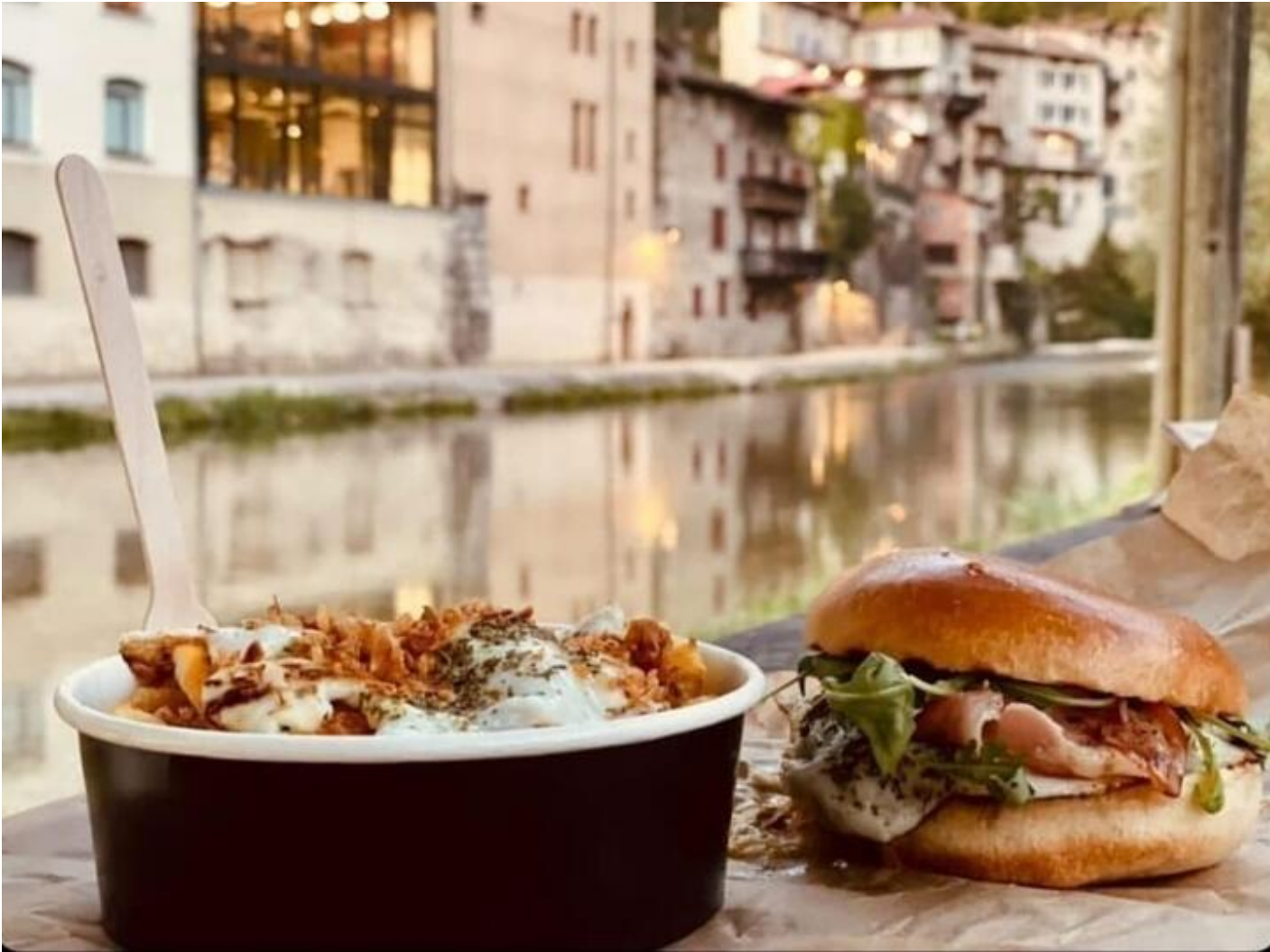
MKM Food 38680 Pont-en-Royans