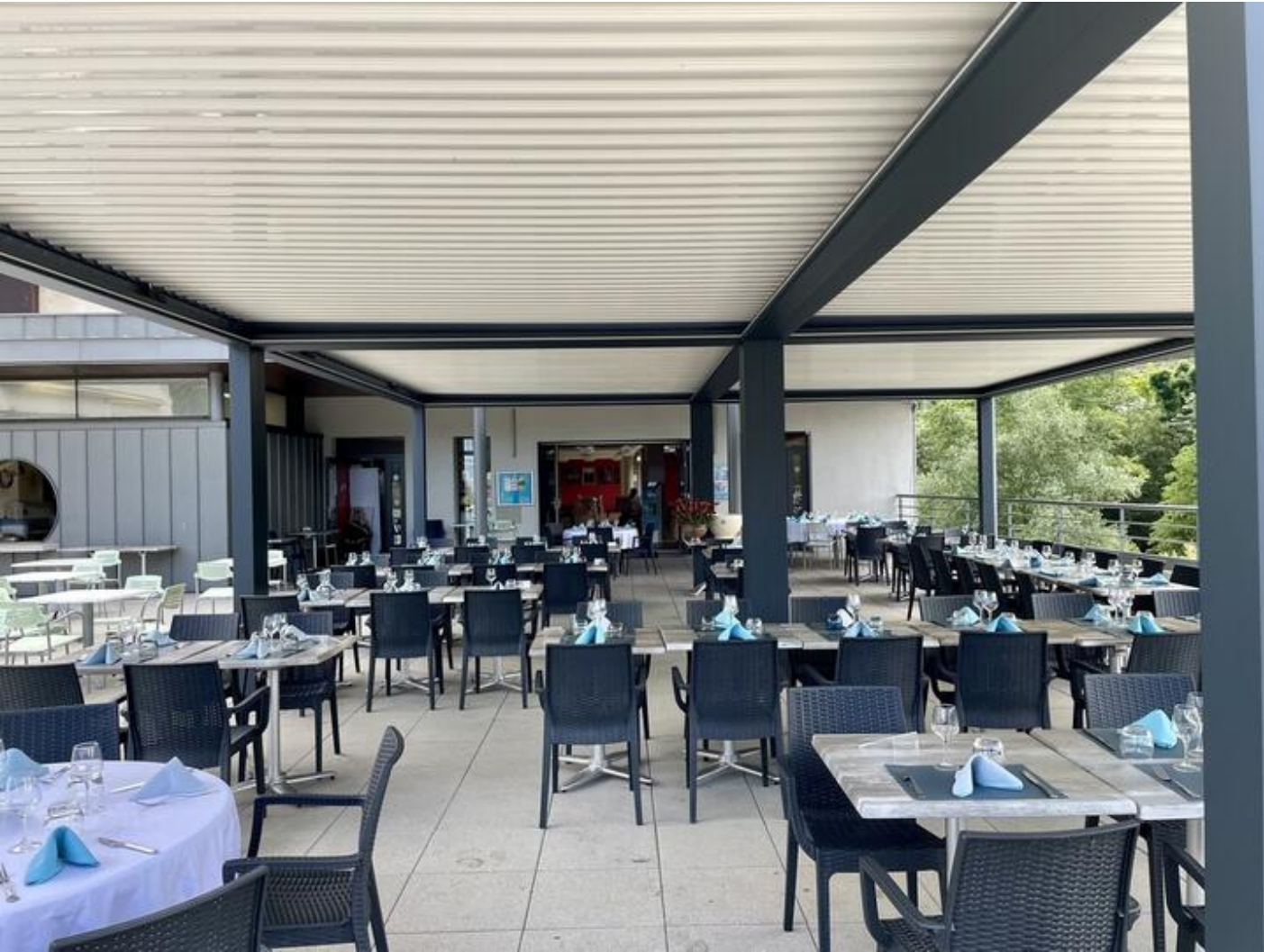
Restaurant du Musée de l'Eau 38680 Pont-en-Royans