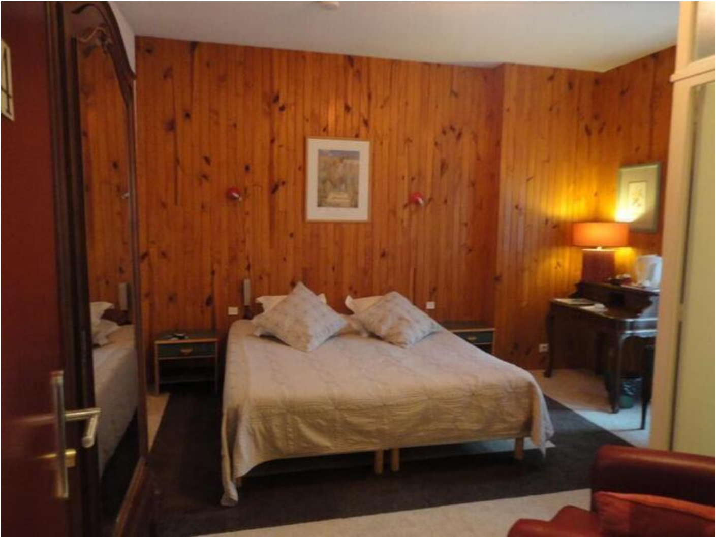
Hôtel Beau Rivage** 38680 Pont-en-Royans