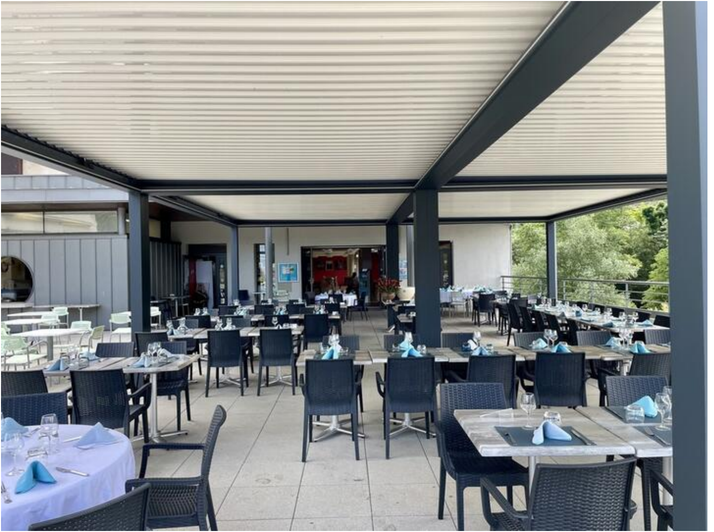
Restaurant du Musée de l'Eau 38680 Pont-en-Royans