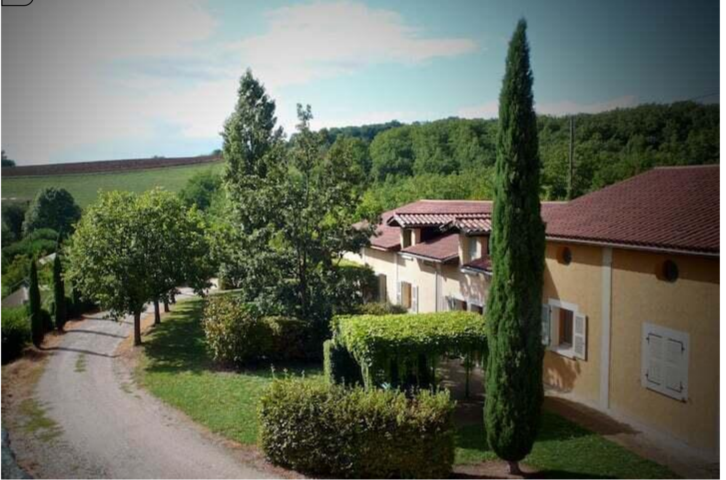
Le Paradis - Gite ocre 38680 Pont-en-Royans