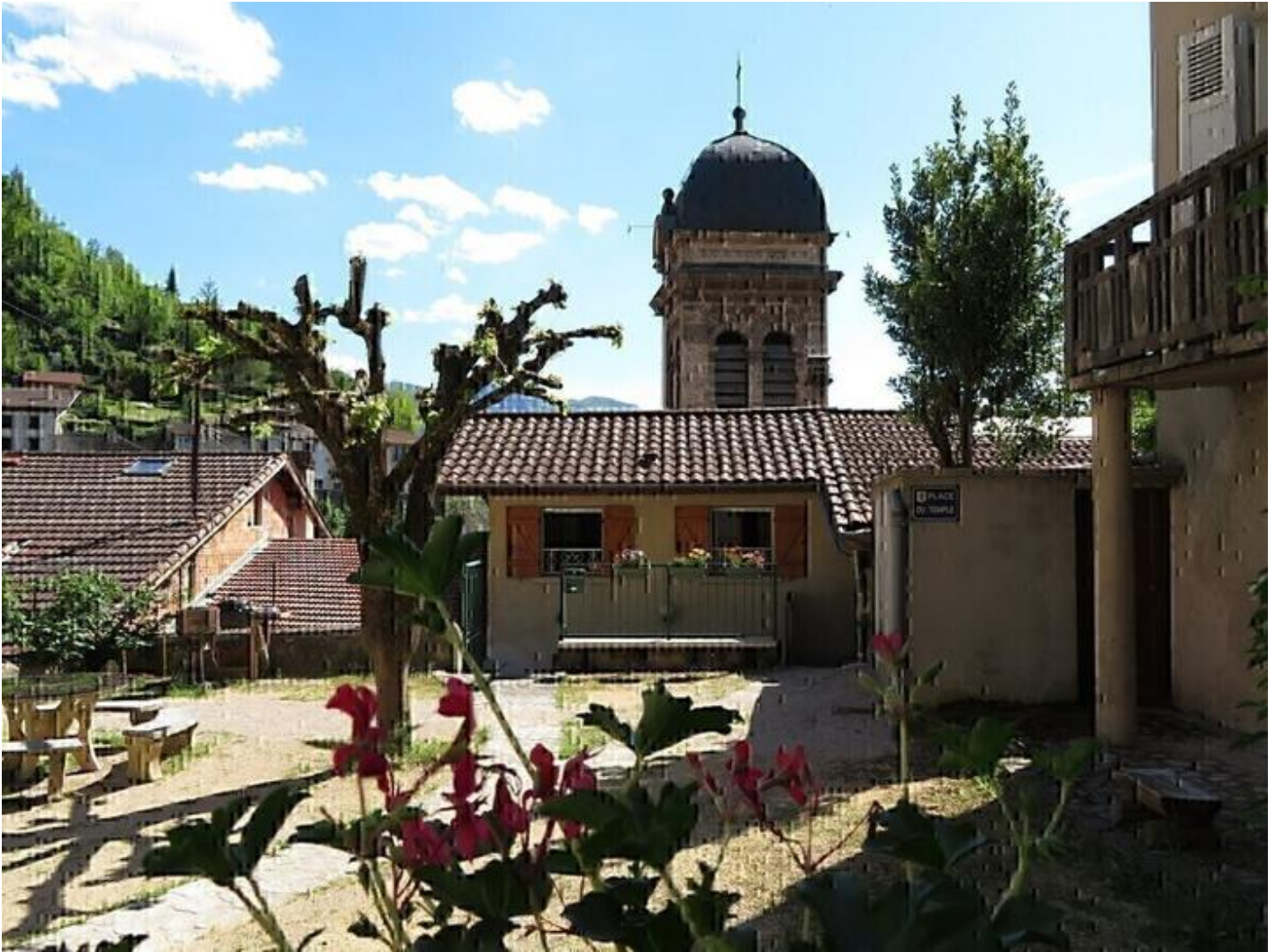
Au Bonheur Suspendu 38680 Pont-en-Royans

Mon gîte équipé avec soin se situe au bout d'une rue médiévale et est le départ de nombreuses randonnées. Proche de toutes les commodités et à deux pas des quais qui longent la Bourne et des maisons suspendues aux rochers. Vous pouvez vous restaurer sur la place publique (barbecue possible) ou la courette à l'entrée du duplex.