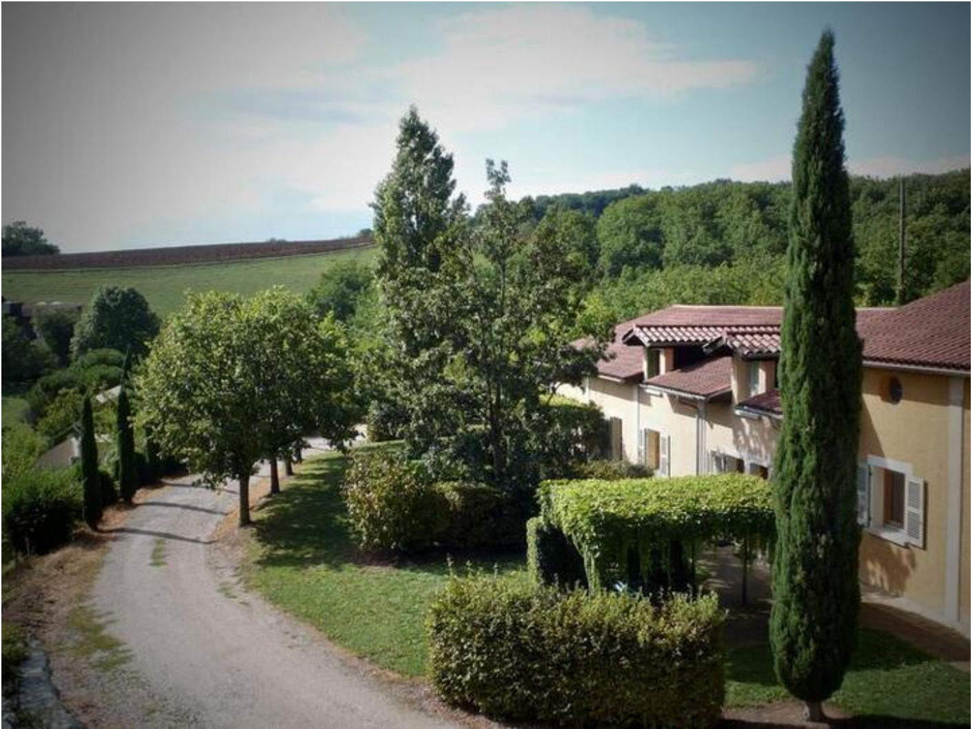
Le Paradis - Gite Vert 38680 Pont-en-Royans

Maison sur les hauteurs du village, comportant 3 gites mitoyens. Superbe vue sur contreforts du Vercors. Gite 3 : séj.-cuisine (l-vaiss., m-ondes, TV) ouvrant sur terrasse avec pergola (sud), s.d'eau, wc, Ch.1(1 lit 2 pers). A l'étage : Ch.2 (1 lit 2 pers.), Ch.3 (2 lits 1 pers.), wc. Terrain, s. de jardin, barbecue. Buanderie en commun : l-linge, équipement repassage. Garage. Tél.portable à disp. Forfait ménage à la demande. A voir : Musée de l'eau, Grottes de Choranche, Gorges de la Bourne. Label Accueil Parc Naturel Régional du Vercors. Borne privative gratuite de recharge pour véhicules électriques sur place (recharge lente 9-10h).