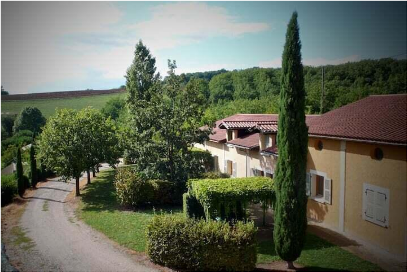
Le Paradis - Gite ocre 38680 Pont-en-Royans