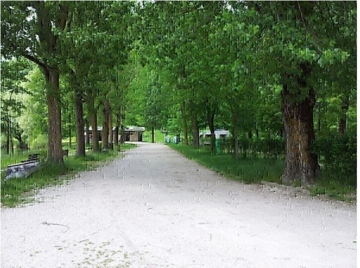
Aire de stationnement " La Plage" 38680 Pont-en-Royans Sur place, pêche, terrain de tennis