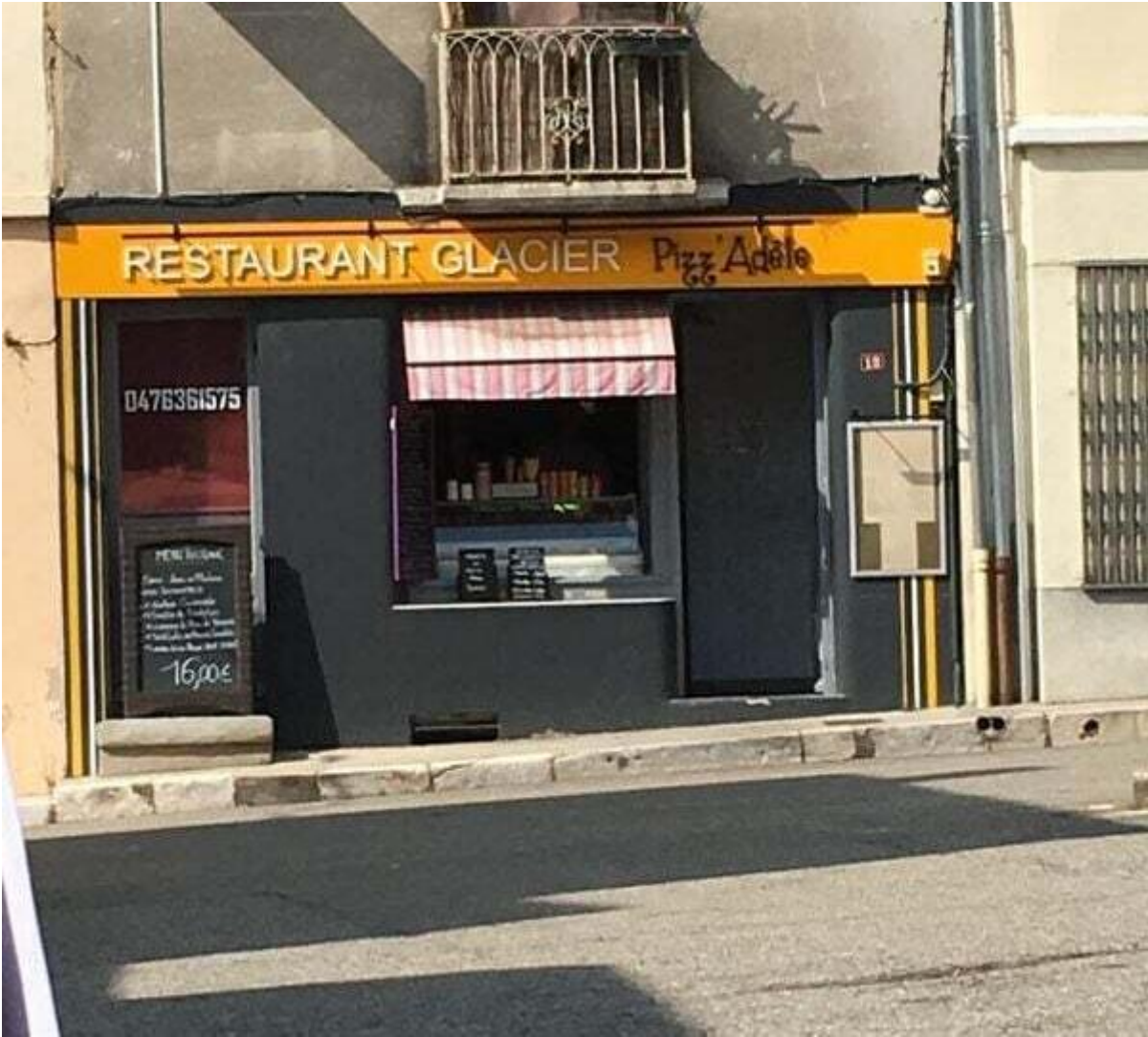
Pizz'Adèle 38680 Pont-en-Royans