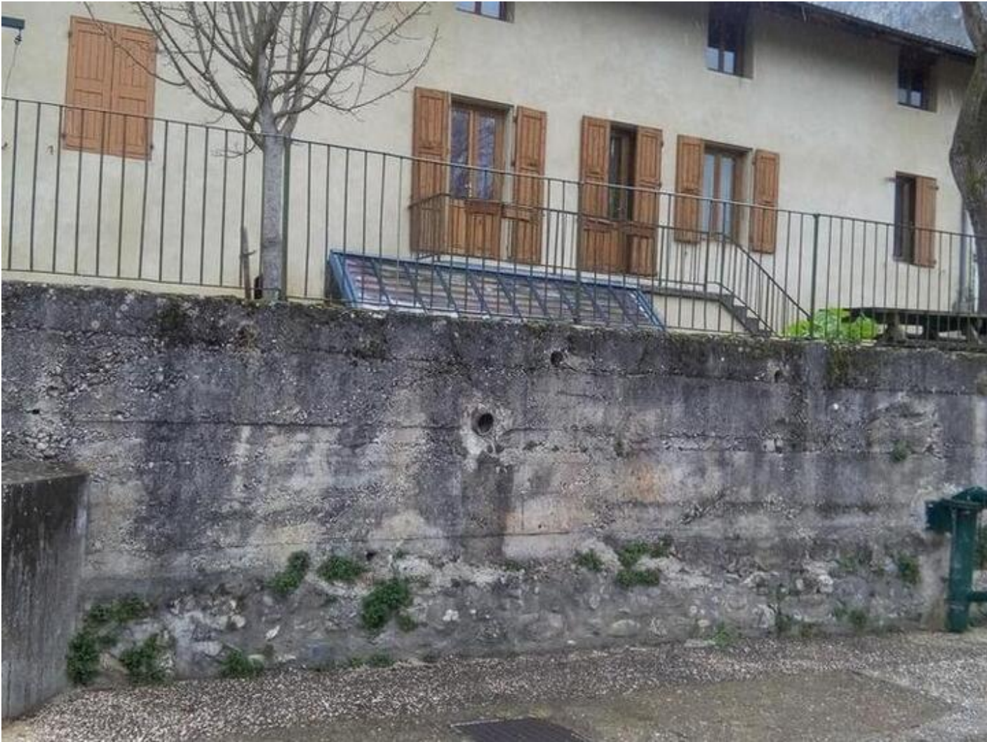
Refuge du Breuil 38680 Pont-en-Royans