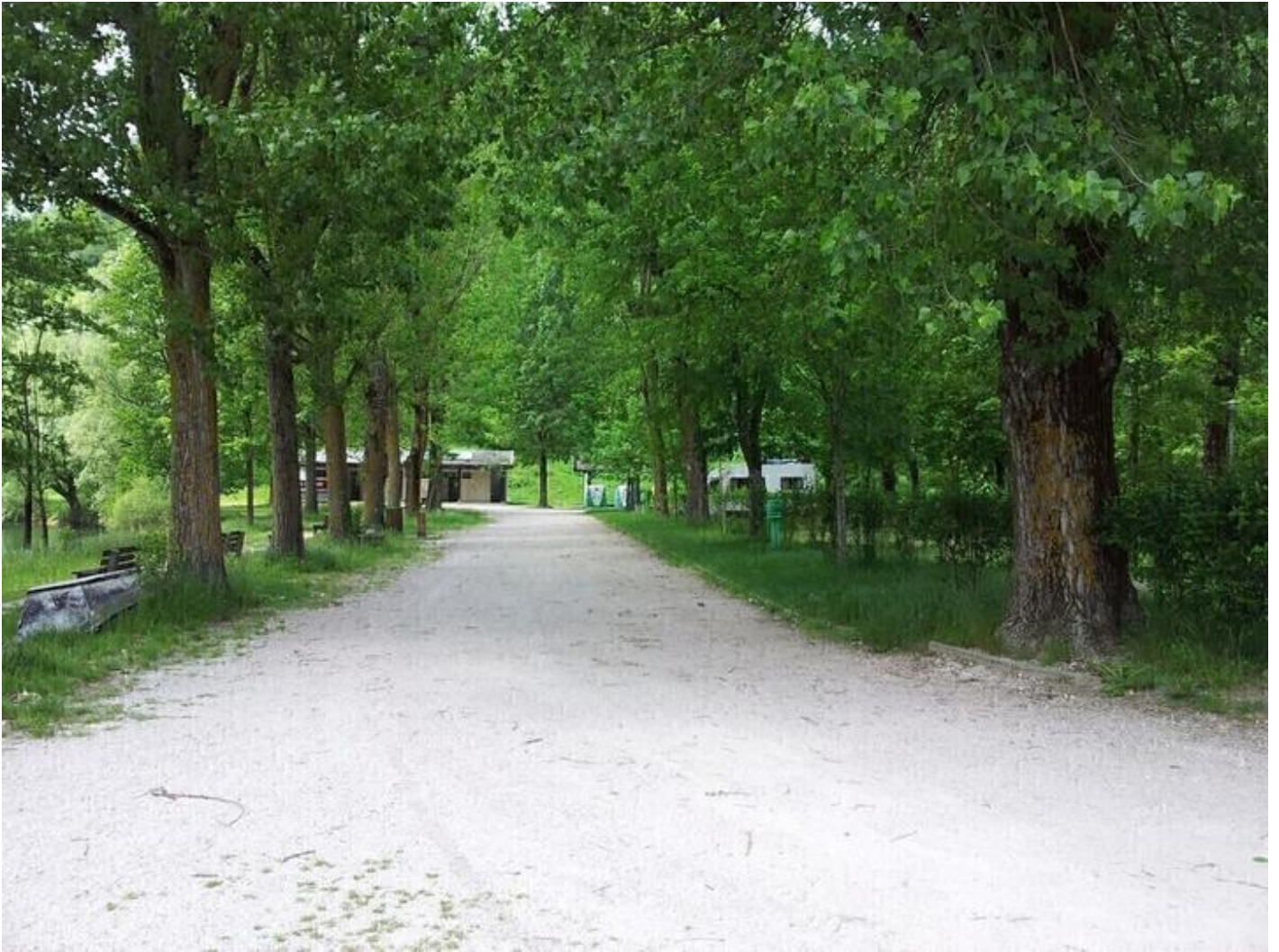
Aire de stationnement " La Plage" 38680 Pont-en-Royans Sur place, pêche, terrain de tennis