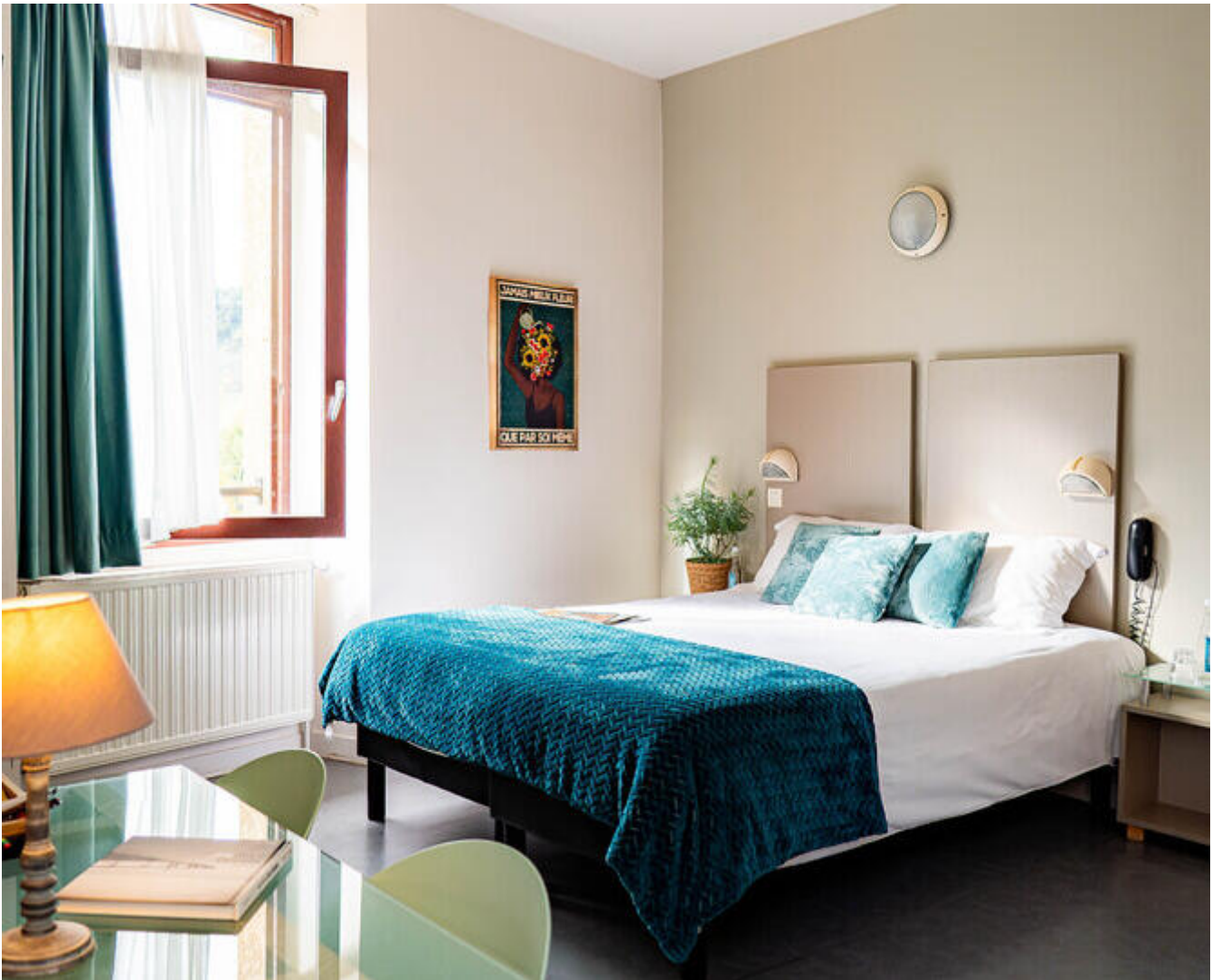
Hôtel du Musée de l'Eau 38680 Pont-en-Royans

La visite du musée de l'eau est offerte aux clients de l'hôtel ! Un moment inoubliable avec 3 salles d'expositions, une salle de projection et un bar à eau unique où l'on vous fait déguster les meilleures eaux du monde !