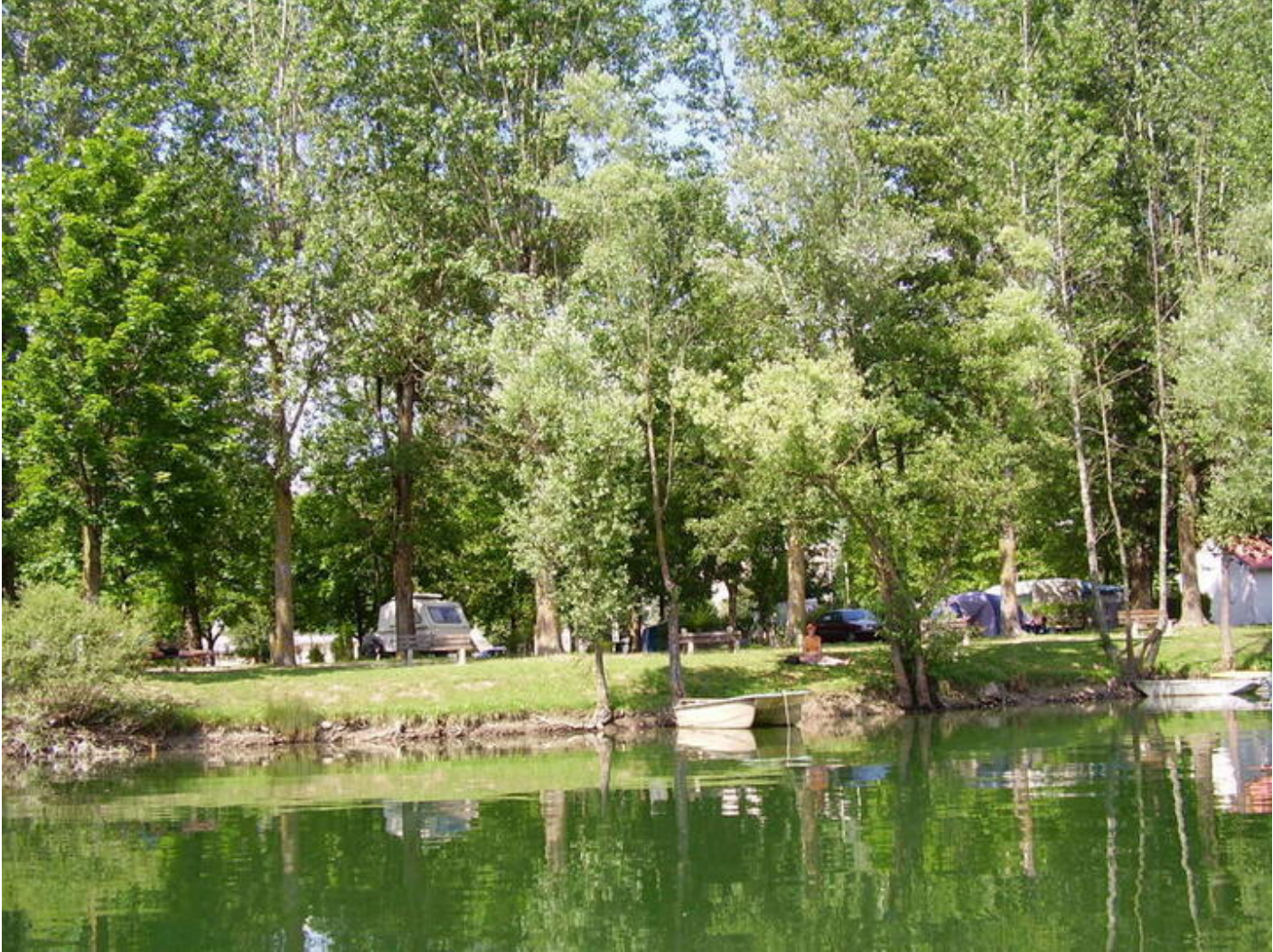
Camping Les Seraines 38680 Pont-en-Royans