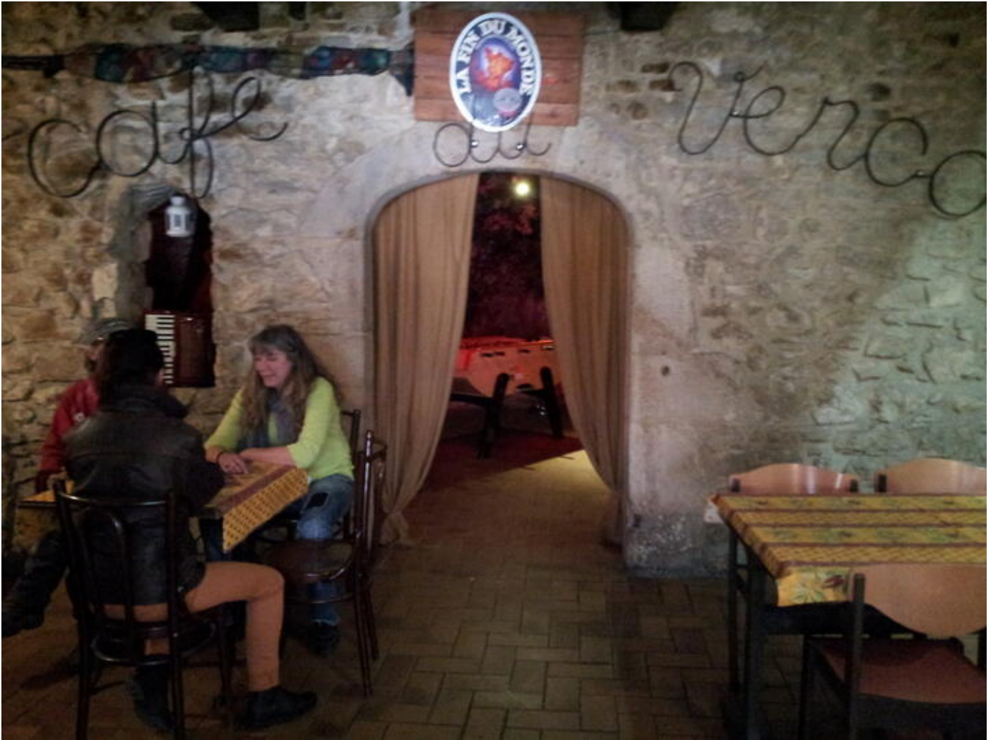
Café Le Vercors